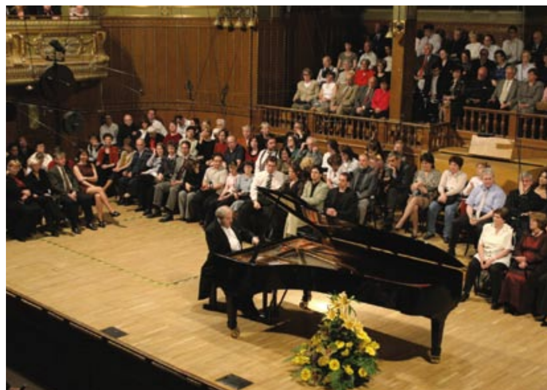
Grigory Sokolov a Zeneakadémia Nagytermében